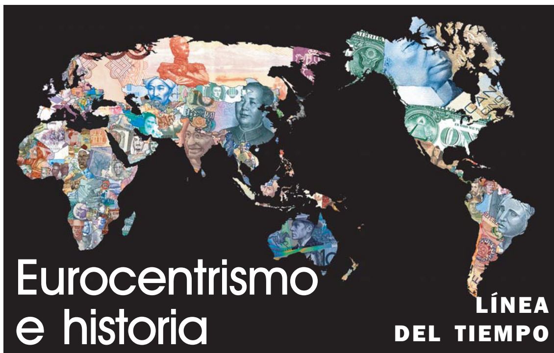
Mapamundi con el Océano Pacífico al centro.