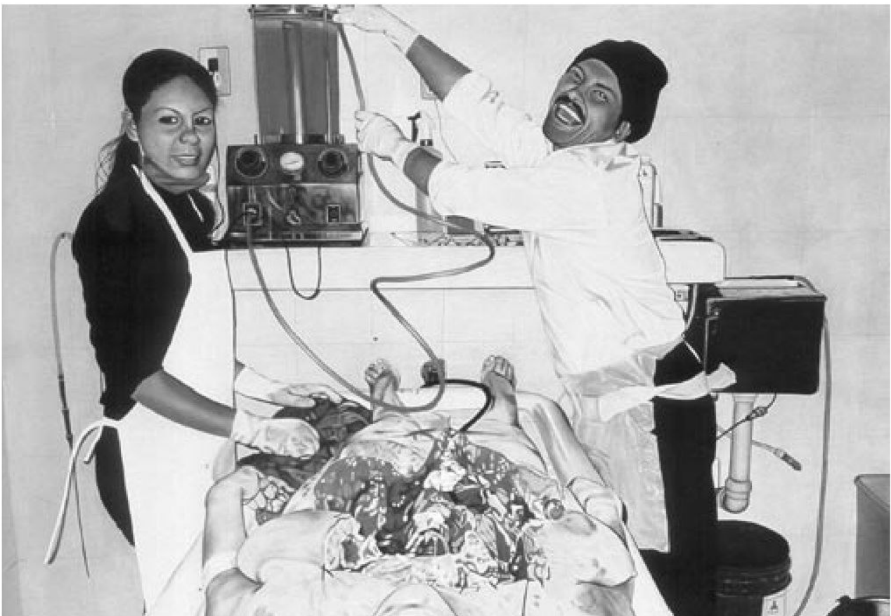
DESNUDO (EN CRISES) / ÓLEO SOBRE TELA / 140 X 180 CM

La clase de anatomía del doctor Nicolaes Tulp de Rembrandt, The gross clinic de Thomas Eakins, son pinturas que ya en su tiempo son objeto del saber científico, pero están aún enmarcadas por el saber académico, por el poder universitario; la importancia de las imágenes de estas lecciones es precisamente que los doctores están presentes para evaluar el cuerpo. Entre los pintores modernos del cadáver se trata del cadáver mismo. La presencia de los embalsamadores en este caso sólo acentúa este hecho. ¿Qué clase de arte es éste que no se preocupa más por los problemas de lo humano? Es decir, ¿qué clase de arte es éste de la modernidad que parece frígido a la interpretación? Como los trabajos de SEMEFO donde no hay más que decir que la exhibición de lo brutal. Y no hay más.