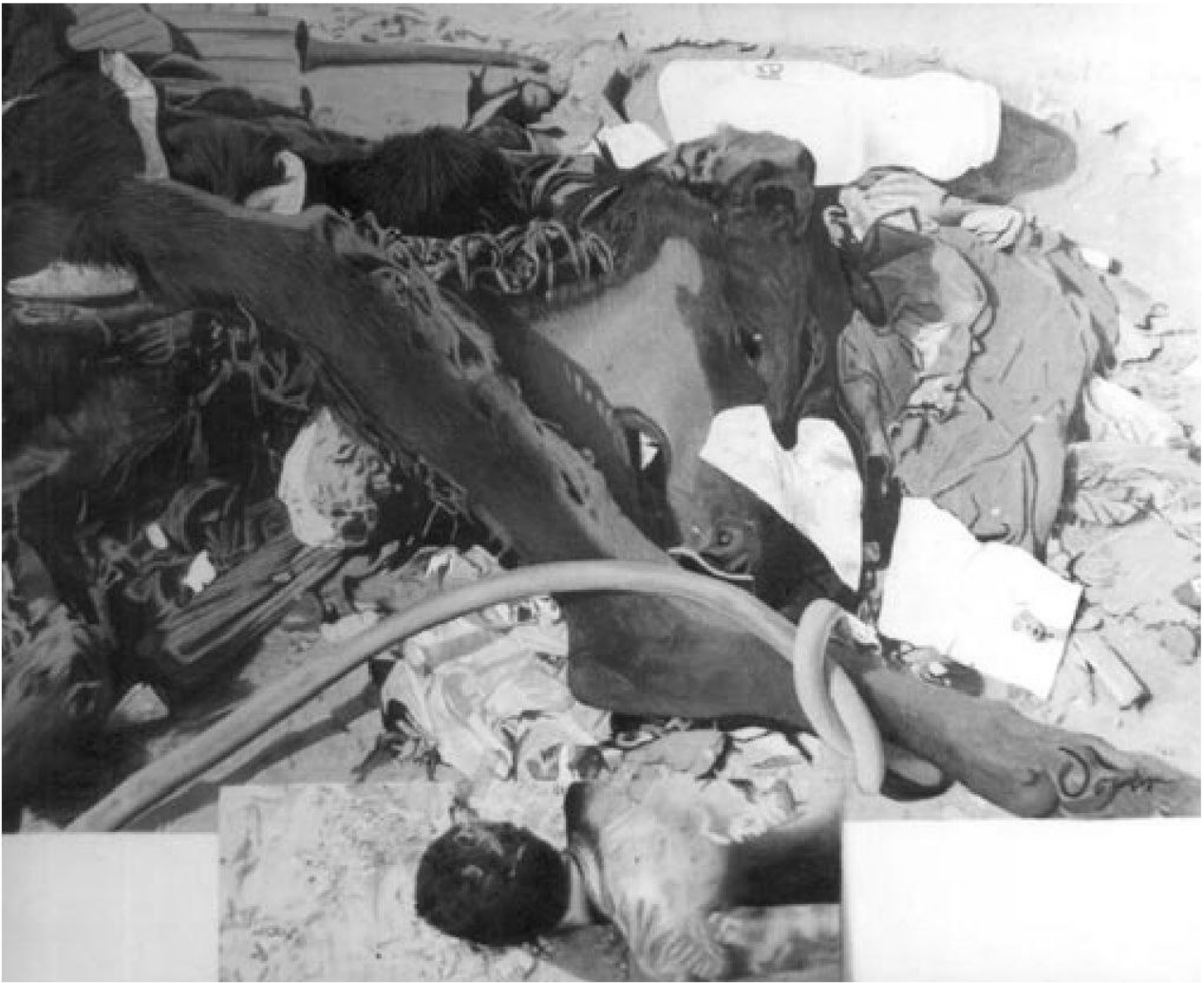
CISMA (EN CRISIS) / ÓLEO SOBRE TELA / 80 X 100 CM

poco expresivo, y puede ser el efecto de la dedicación a la técnica y de amar mucho lo que hace, porque la técnica es algo que cuesta tanto tiempo y trabajo y se puede volver muy difícil tomar riesgos. La destreza técnica que exige una pintura como ésta puede llegar a tomar décadas para dominarse, pero la expresividad no se sostiene sola en la técnica, se sostiene también en tener algo importante que decir, y no sólo en esto sino en aprender a decirlo con sinceridad respecto a las propias inseguridades. Aunque un desarrollo formal y una inquietud flojas son la consecuencia de una ambición comercial, éste no es el caso. Omar Sánchez no está ávido de dinero con interés que le estorbe a la hora de su oficio; no lo parece, al contrario, pues hay una obstinación con su manera de realizar un cuadro. Tal vez se trate de que el tema del cuerpo