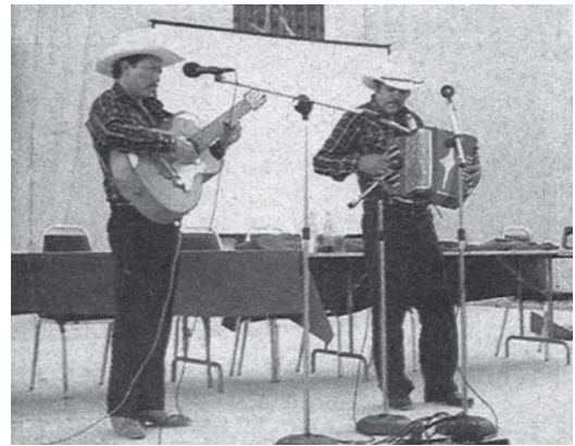
Los platillos, dulces y pan de la región, música en vivo de conjuntos regionales y la presencia de la gente del pueblo revivieron las fiestas de San Pedro y San Pablo tras medio siglo de no realizarse en el antiguo casco de la hacienda.