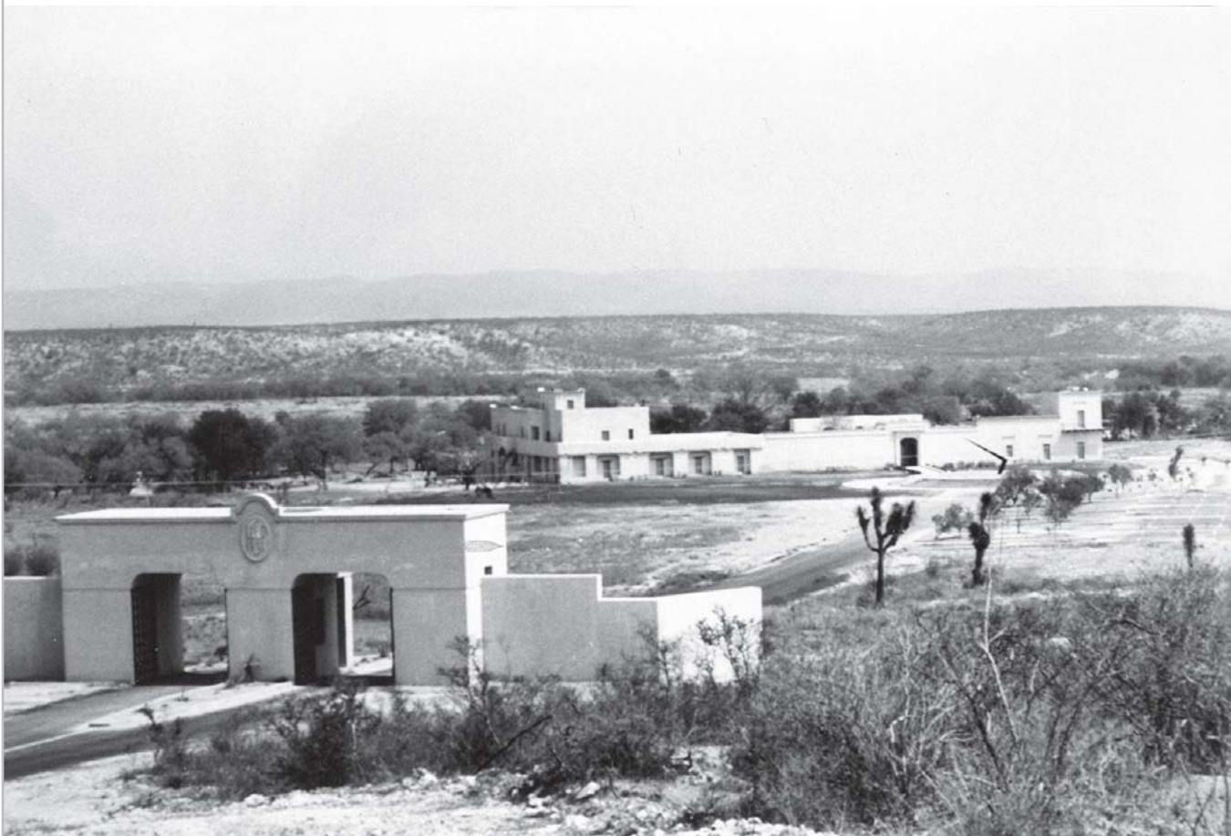
Así lucía la hacienda en Zuazua al término de su restauración en 1990 y lista para alojar las fiestas de San Pedro y San Pablo.

El programa elaborado para las fiestas contempló cinco ejes temáticos en sus actividades culturales, recreativas y deportivas