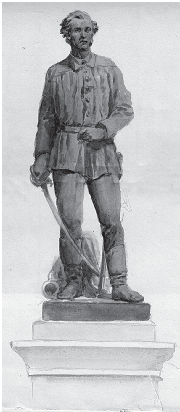
Boceto en acuarela de fray Servando Teresa de Mier y del general Juan Zuazua. Fundición Artística Mexicana.