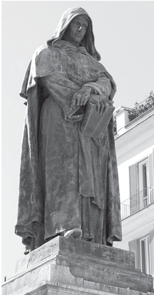
La obra de fray Servando fue “casi copiada” de la famosa estatua del dominico italiano Giordano Bruno, astrónomo, filósofo, matemático y poeta, ubicada en Campo de Fiori en Roma, Italia, y realizada por Ettore Ferrari en 1887.

Escobedo, pues ellos conocieron en persona al general Zuazua; ambos personajes coincidieron en el parecido de la obra con el general Zuazua 35 .