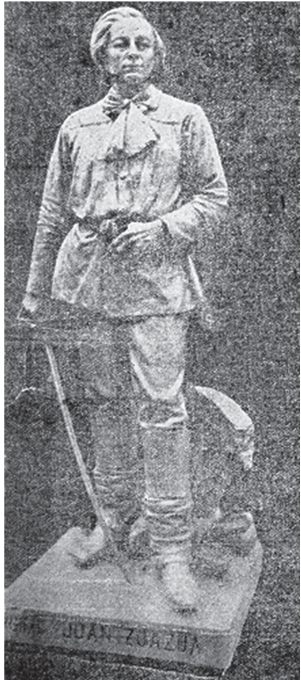
Los patriotas del Paseo de la Reforma , México, Litográfica Machado, s/a.