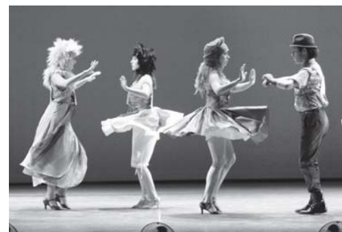
Desierto bajo escenografía lunar