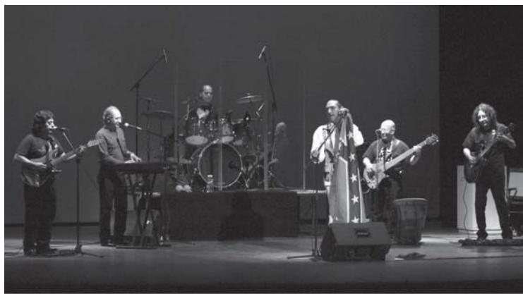
Una noche excepcional de rock clásico se vivió con el concierto a cargo del grupo Cactus el 18 de julio dentro de las actividades de la Escuela de Verano UANL 2010.