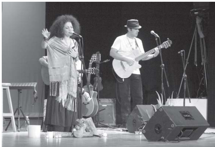
Desde son cubano hasta nueva trova, cumbia, bolero y ranchero, el concierto "Cardo" a cargo de Paloma Negra cerró el 25 de julio las actividades de la Escuela de Verano.