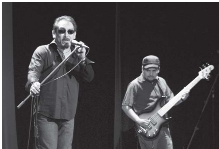
En el Aula Magna la banda Fonzeca-Caja de Pandora Project ofreció el 20 de julio un viaje a través de las raíces del género en el concierto titulado "Blues".