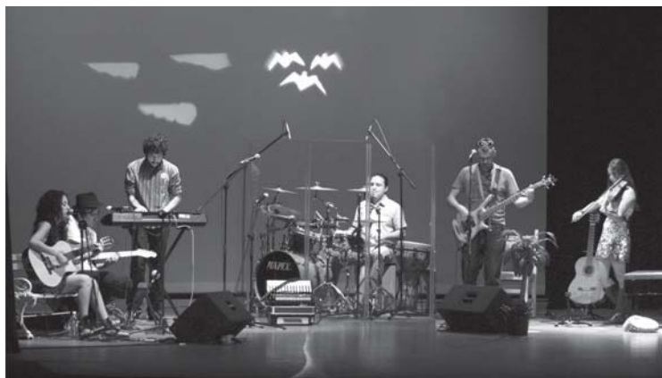
La banda Magdulia regaló folk, pop, rock y country en su concierto "Magdulia electroacústico" el 22 de julio en Colegio Civil Centro Cultural Universitario.