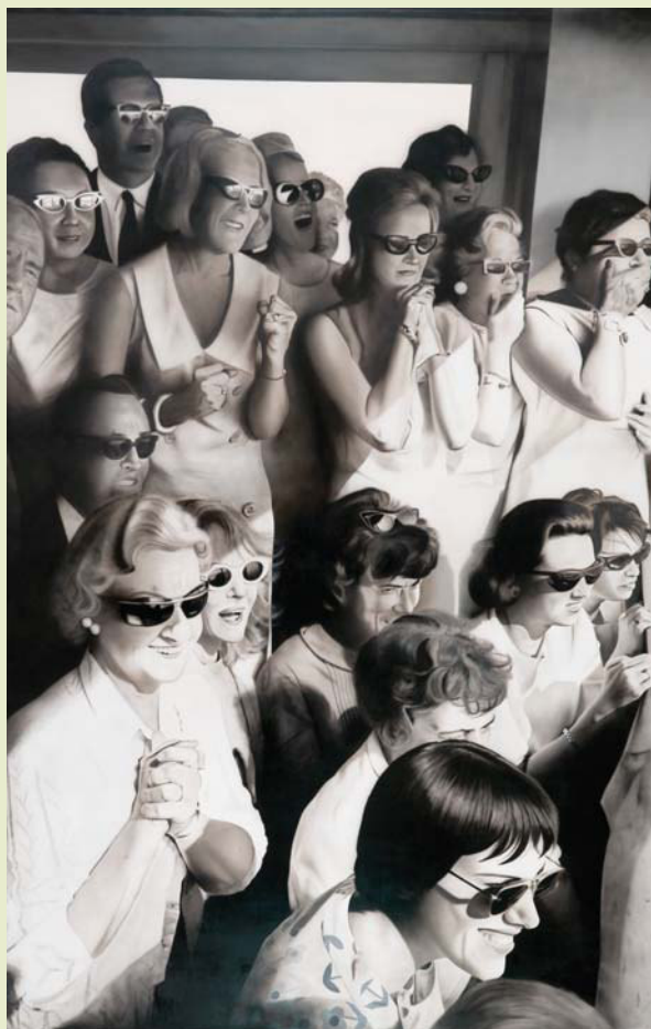
Adrian Procel. Expectation acrílico sobre tela

Registro 02. Mirar por segunda vez incita a la contemplación y a reconocer el proceso ejecutado durante la observación a través de más de cincuenta obras con un denominador común: el gesto estético y la exploración a través del juego y del lenguaje de lo que llamamos arte.