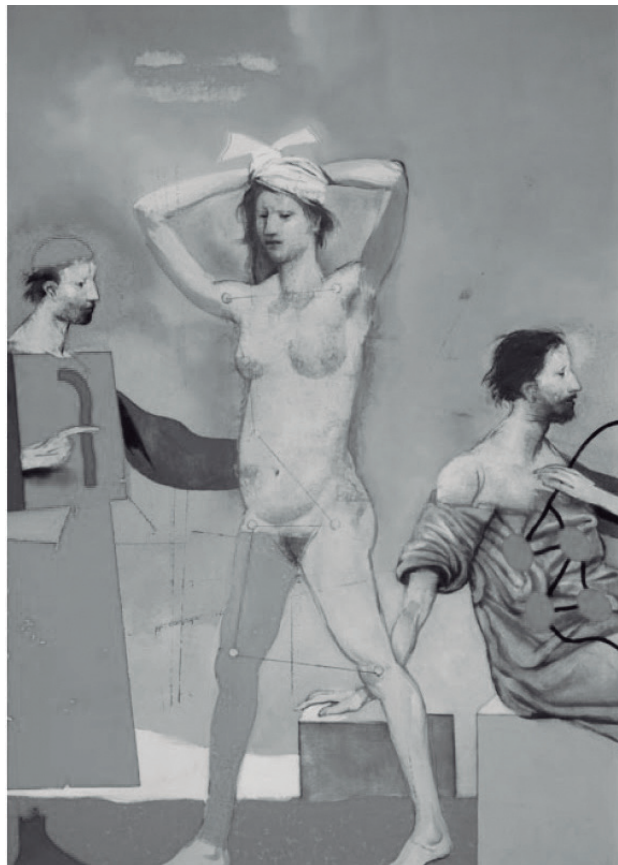
Sin Título, 2002

Pero a pesar de la postura condescendiente de Sáenz ante la popularidad en ascenso de Fidencio, no era posible ocultar el problema de salud pública en Espinazo. Santiago Roel, apoderado jurídico de los Ferrocarriles Nacionales de México, advirtió al gobierno sobre ese asunto en una carta fechada el 10 de enero de 1930. En dicha carta, Roel manifiesta su preocupación por la invasión de terrenos de la compañía ferrocarrilera en Espinazo. También