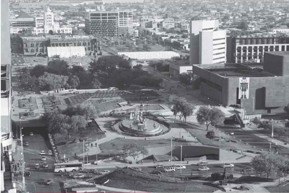
Imagen: David Picón