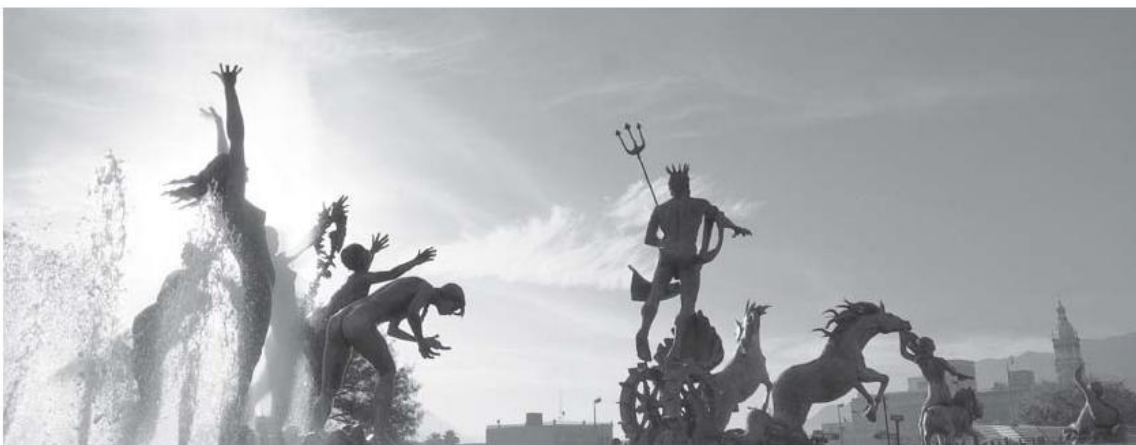
Imagen: David Picón

Una vez más, los esfuerzos y voluntades de algunos hombres son guiados intuitivamente por el atavismo cultural que confirma a la ciudad como tal, cuando se manifiesta grandilocuente la presencia asociada del binomio de arquitectura y escultura, arquetipo de prestigio cultural que opera desde tiempos re-