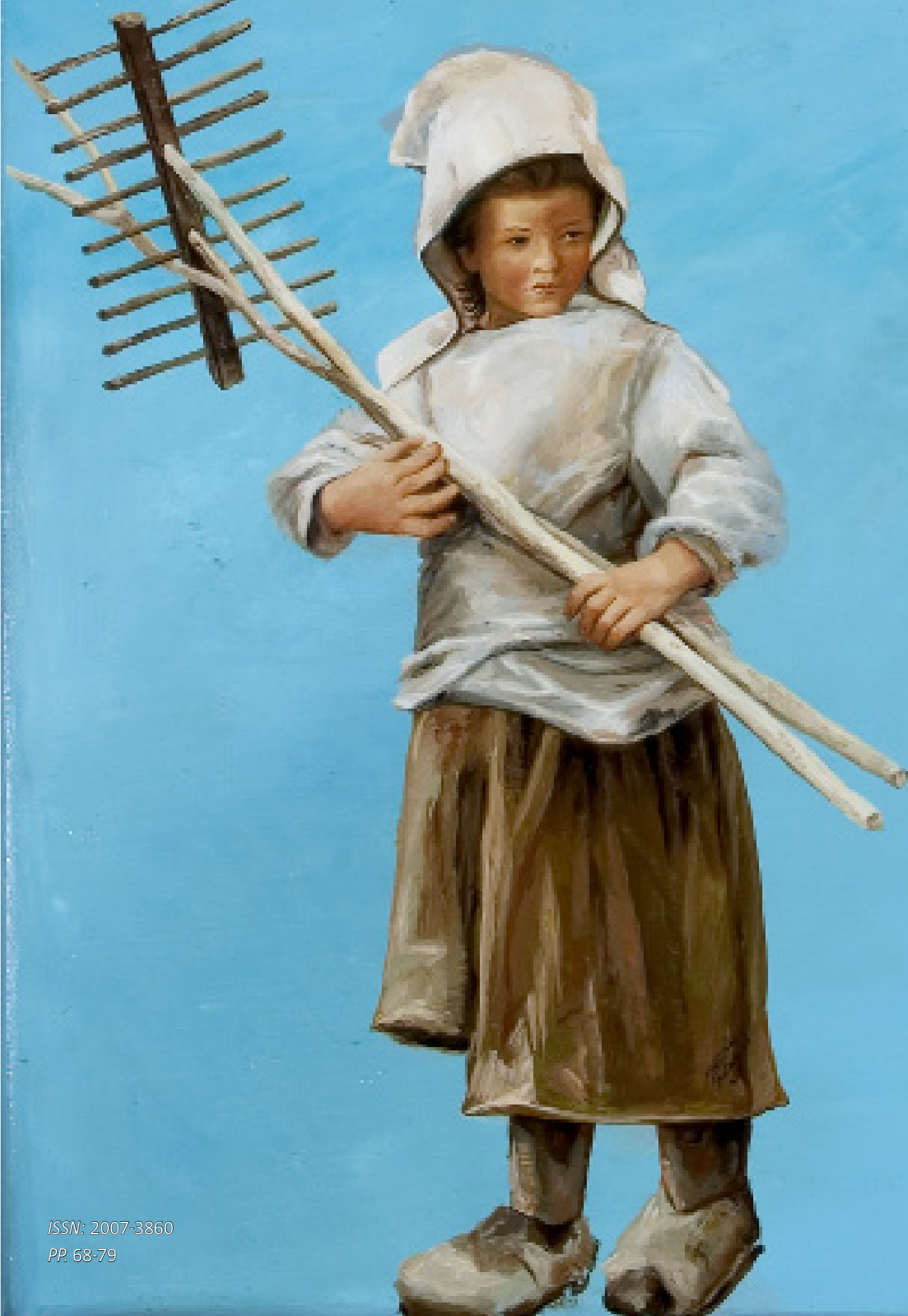
"Reflejo en pantalla azul para la creación de la Siega del Heno" (de la serie Diarios de viaje y desplazamientos) 2004. óleo sobre lienzo. 46 x 44 cm. colección particular