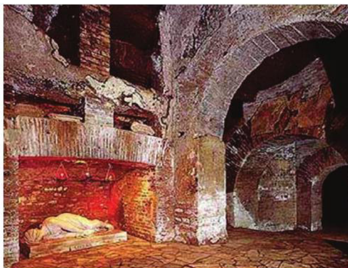
Cripta de Santa Cecilia

Es un poco incierto el motivo por el que Cecilia terminó siendo la patrona de la música. Se dice que el padrinazgo de la música le fue otorgado debido al relato de su martirio en el que demostró su convicción al entonar el salmo LXX. Su espíritu sensible y apasionado por este arte convirtió así su nombre en símbolo de la música.