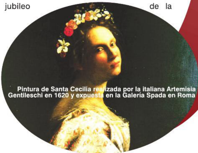
Pintura de Santa Cecilia realizada por la italiana Artemisia Gentileschi en 1620 y expuesta en la Galería Spada en Roma

Cecilia pertenecía a una de las principales familias de Roma, además había consagrado a Dios su virginidad. Fue arrestada por soldados romanos quienes le exigieron que renunciara a la religión de Cristo. Ella declaró que prefería la muerte antes de renegar de la verdadera religión. Fue condenada a morir ahogada en el baño de su propia casa. Como sobrevivió, trataron de asfixiarla en humo, pero también permaneció ilesa en el ardiente cuarto. A pesar de haber pasado más de un día en semejantes condiciones, comenzó a cantar el salmo LXX: “Que mi corazón y mi carne permanezcan puros, oh Señor, y que no me vea defraudada en tu presencia” . Se decidió decapitarla allí mismo. El ejecutor dejó caer su espada tres veces pero no pudo separar la cabeza del tronco. Huyó, dejando a la virgen bañada en su propia sangre. Cecilia vivió tres días más,