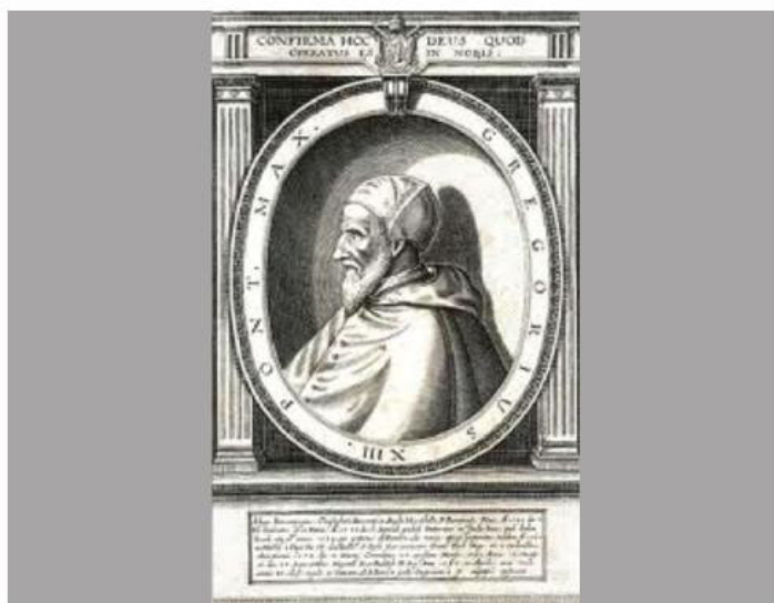
Imagen del papa Gregorio XIII