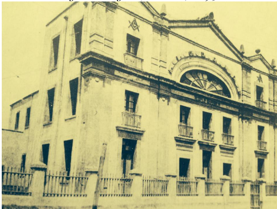
Fig. 2. Gran Logia de Nuevo León, ca. 1915.