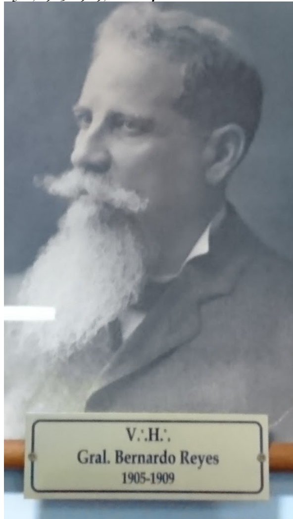
Fig. 1. Retrato del gran maestro de la Gran Logia del Estado de Nuevo León, general Bernardo Reyes, 1905-1909, en la oficina administrativa de la misma.

Logia de Nuevo León a partir de tres Respetables Logias Simbólicas: “Obreros del Silencio” No. 1, “Constancia” No. 2, y “Victoria” No. 3 19 , recibiendo su carta patente extendida por la Gran Logia de Veracruz “Unida Mexicana”.