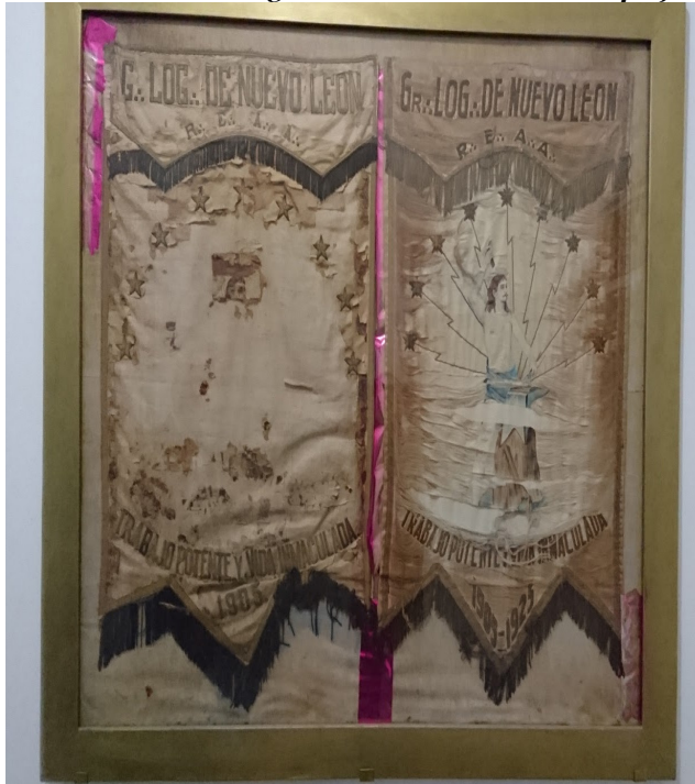
Fig. 3. Estandartes de 1905 y de 1925 de la Gran Logia del Estado de Nuevo León, mostrando una alegoría de Hércules en una forja.

este desierto neolonés, y se formó el gran núcleo que nos dio la soberanía legitimada con el establecimiento de la Gran Logia, en 24 de junio último, y luego instalamos un taller más, en julio siguiente, y concedimos a dos grupos que se hallan fuera de esta capital, dispensa para preparar su organización en forma, y aquí venimos hoy a legitimar al que se encontraba en Monterrey en ese estado; y así la constelación neolonesa masónica, brilla; y en el espacio, como nubes baladas por crepúsculos, flotan estandartes; y esas realidades vivientes, son el testimonio glorioso de nuestra labor fertilizadora. 24