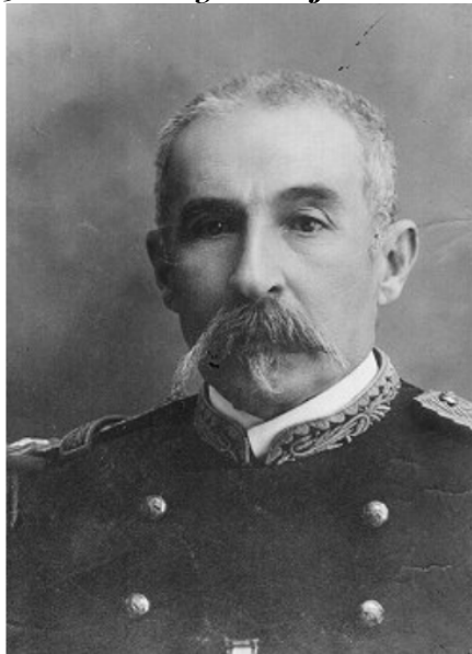
Fig. 5. Retrato del general José María Mier